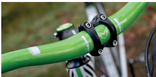
Řada komponentů nese logo Felt, jejich kvalita je bezproblémová

SR Suntour a brzdy Shimano M446. Zatímco ty se výkonem blýskly, vidlice se ukázala jako nejslabší v testu. O nějaké citlivosti na malé podněty tu nelze mluvit, navíc lehce přidrhuje a v běžném provozu pracuje tak se třetinou svého zdvihu. Hluběji ji dostanou až opravdu velké rázy. Malé a střední překážky tak bohužel s grácií přehlíží. Nastavit lze předpětí pružiny, nikoliv však odskok – i při nízké hodnotě předpětí se