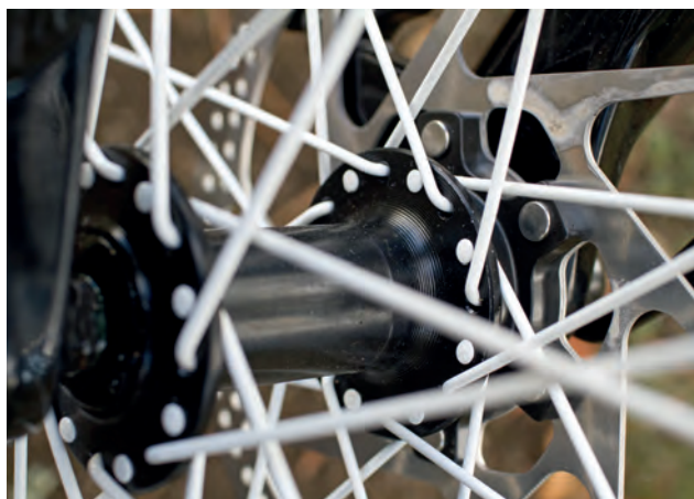
Celkově svěží design kola podtrhují i bílé výplety

tak vidlice po stlačení vrací hodně zhurta zpět. V zamknutém stavu je zcela nečinná – k téměř stejnému jevu ale bohužel dochází i při nízké teplotě (a to i při několika stupních nad nulou).