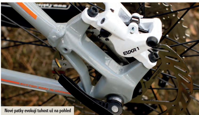
Nové patky evokují tuhost už na pohled

jen sedlových vzpěr na horní trubku, jež vytváří třetí rámový trojúhelník, zůstává, a to i s přesahem horní trubky za sedlovou.