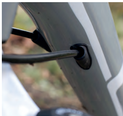
Vnitřní vedení bowdenů řazení spodní trubkou – řešení používané ve vyšších cenových hladinách