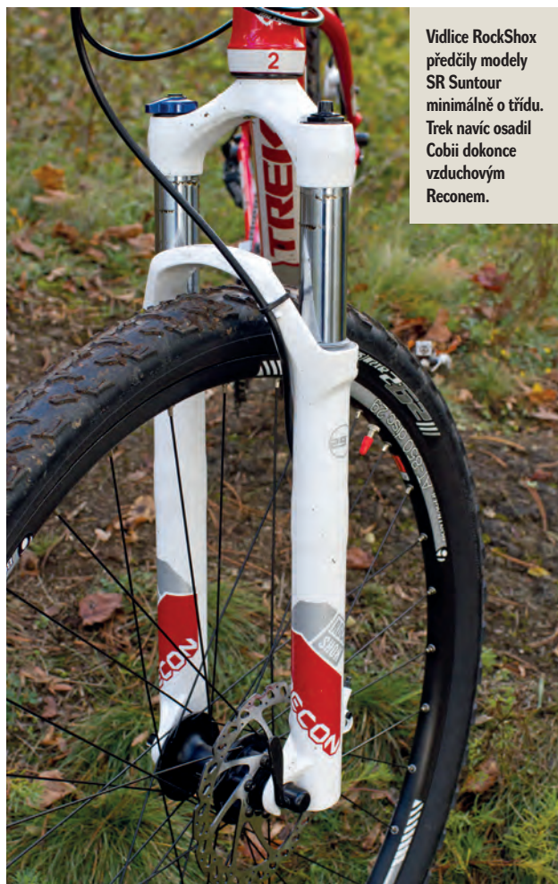
Vidlice RockShox předčily modely SR Suntour minimálně o třídu. Trek navíc osadil Cobií dokonce vzduchovým Reconem.

geometrie (vel. 17,5"): a – 445 mm, b – 445 mm, c – 602 mm, d – 1116 mm, e – 72,5°, f – 69,3°